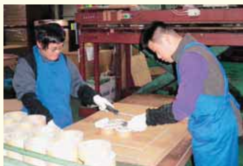
企業内で作業に取り組む様子

まだまだ多くの課題がありますが、こうした仲間がいることを励みに就労支援を頑張っていきます。これまでに引き続き、今後ともどうぞよろしくお願いいたします。