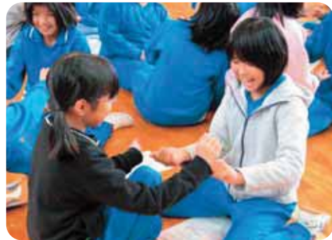
相手に合わせるって、思ったより難しい

内容は、相手との視線を合わせることの大切さを学ぶなど、目的に合わせ、全部で5つのゲームを実施しました。そのうちの2つを紹介します。