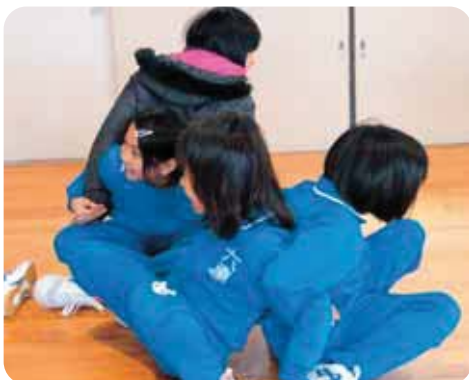
友達を信頼して、一緒に立つことができるかな

②トラストアップ（最初は二人一組で手をつないで一緒に立ち上がる。順に人数を増やし、最後は全員で円になり立ち上がる。）相手を信頼すること、また相手のペースに合わせることを経験しました。最後に54人全員が体育館いっぱいに円になり、誰一人手を離すことなく立ち上がることであった時には、自然と大きな拍手が生まれました。