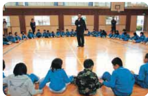
54人全員で手をつないで立ち上がります

①1分間ゲーム（全員立ったまま、目をつぶり心の中で1分数え、1分経ったと思ったら静かに座ってもらう。）最初に座った人と最後に座った人の時間の差は30秒。1分という時間は決められているのに、30秒の違いはなぜ生まれたのか考えてもらいました。感じ方は一人ひとり違う。この「違い」が個性ということを理解しました。普段生活している中で接する、高齢者や障がいのある方も一人の人間、個性ということを学びました。